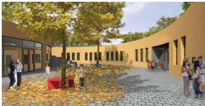
Z architektonické studie nového objektu ZŠ a ZUŠ Líbeznice Autor: Ing. Arch. David Grulich

Z aktualizované demografické prognózy jasně vyplývá, že ani další objekt v Líbeznících potřebu nových míst ve škole neuspokojí. Stavět se bude muset ještě v jiné obci či v jiných obcích. Na další školy či dvě menší školy je čas do 1. září 2024. „Na první pohled to vypadá, že je času dost. Ve skutečnosti ale ani v tomto případě žádný čas nemáme. Musí se okamžitě začít s přípravou. I proto jsme tlačili na to, aby součástí dohody