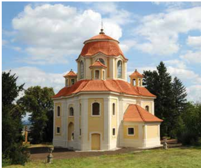
Největší tahák na trase je Santiniho kaple v Panenských Břežanech

Výlet lze zakončit v Dolínku nebo Odoleně Vodě. V rodném domě Vítězslava Háška v Dolínku je k vidění expozice zaměřená na básníkův život a dílo. Otevřeno mají celoročně v neděli odpoledne, větší skupinu je však možné nechat objednat i na všední den. V Odoleně Vodě zase nelze vynechat kostel sv. Klimenta vystavěný ve 30. letech 18. století proslulým barokním architektem a stavitelem Kiliánem Ignácem Dientzenhoferem. Od kostela položeného na vyvýšeném místě máme Polabí jako na dlani, třeba i blízkou přírodní rezervaci Kopeč s dvěma pahorky sopečného původu, celou řadou vzácných rostlin i hmyzu, především pavouků.