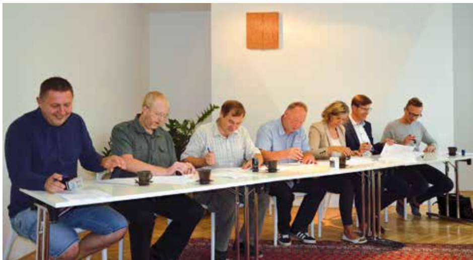
Podpis smluvních dokumentů byl slavnostním okamžikem

Podpisem dokumentů vyvrcholilo déle než rok trvající snažení všech zúčastněných obcí o řešení kritické situace. Téměř každý měsíc se setkávali starostky a starostové a proběhla zároveň tři veřejná společná jednání zastupitelstev všech obcí. „Společná dohoda o obří investici a řešení opravdu