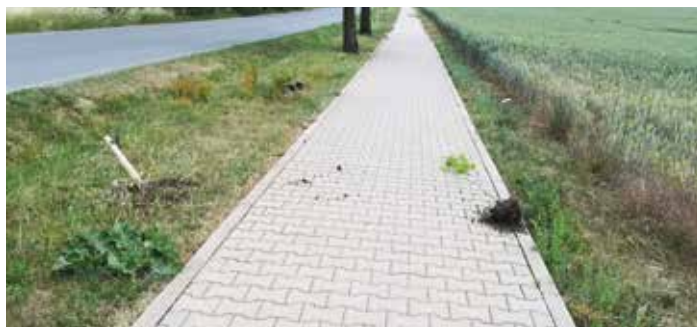
Řádění vandala odnesla desítka stromů, které si zasadili sami baštěčtí občané

Díky všímavým občanům, kteří reagovali na výzvu obecní policie Líbeznice byl dne 8. 6. 2018 dopaden obecní policií Líbeznice pachatel, který dne 5. 6. 2018 v době mezi 12 a 13 hodinou poškodil několik stromků u cyklostezky mezi obcemi Bašť a Líbeznice. Jedná se o dvacetiletého mladíka s vazbami na obec Bašť s trvalým bydlištěm v Praze.